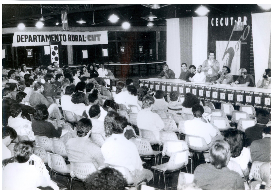
5º CECUT: Vanguarda das plataformas dos trabalhadores

A Central Única dos Trabalhadores chega ao seu 12º Congresso Estadual com temas importantes para a classe trabalhadora. O evento está inserido no meio de uma disputa política entre as principais centrais sindicais, mas, sobretudo, no princípio de Liberdade e Autonomia.