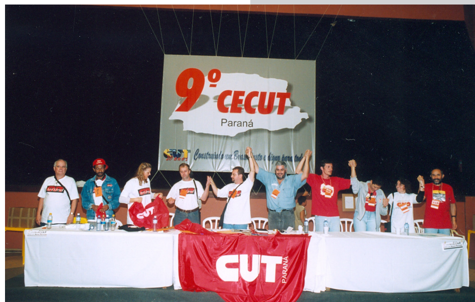
9º CECUT: Trabalhadores construindo a história do Brasil